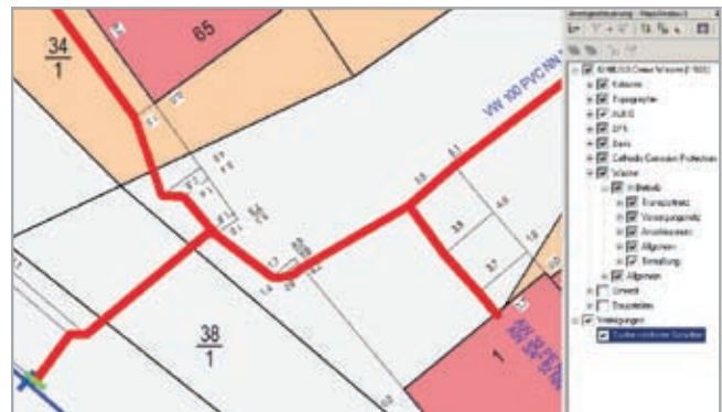
Netzverfolgung mit Ermittlung des nächsten Schiebers