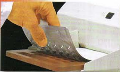
Verschweißen und 18 Stunden bei 36°C inkubieren