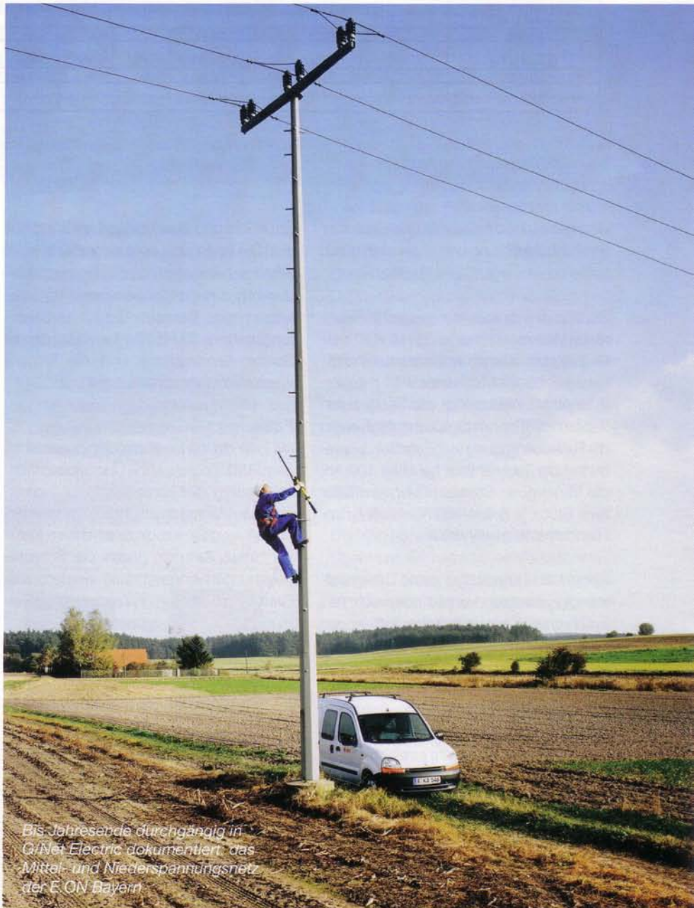
Bis Jahresende durchgängig in G/Net Electric dokumentiert, das Mittel- und Niederspannungsnetz der E.ON Bayern

Das Nebeneinander der unterschiedlichen GIS-Lösungen und die Unterschiede in Darstellung und Qualität stellen Barrieren dar: Netzdaten können nicht unternehmensweit eingesehen und gepflegt werden. Daher schaffte sich E.ON Bayern ein GIS an, das alle Datenbestände in einer