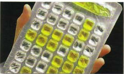
Ergebnisse ablesen Gelbe Vertiefungen = Coliforme Gelbe/fluoreszierende Vertiefungen = E.coli