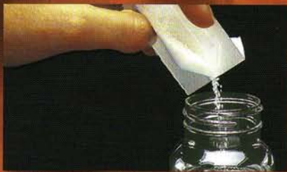
Coilert®-Reagenz der Probe hinzufügen