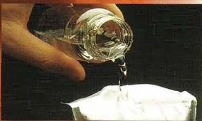
In den Quanti-Tray eingießen