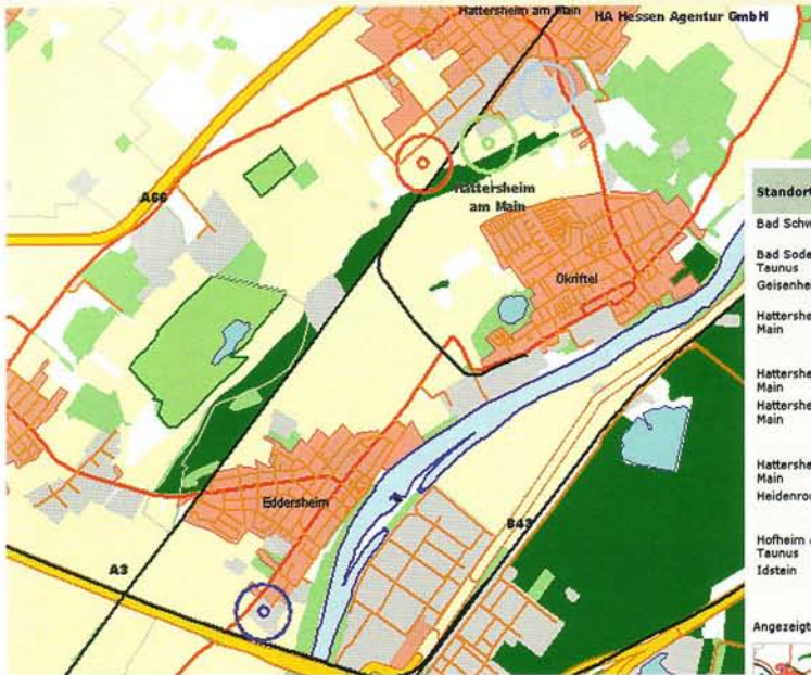
Ergebnisliste einer Gewerbeflächensuche