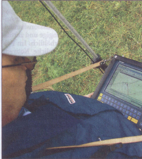
Feldeinsatz: Zugriffe auf Geo- und Sachdaten unterstützen die Bewag-Techniker und verkürzen die Fehlersuche im Störfall.

Für die SAP-Schnittstelle kommt der G/Net Integrator von Intergraph zum Einsatz, dessen Schnittstellenfunktionen sich