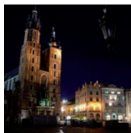
16 KWIETNIA - KRAKÓW