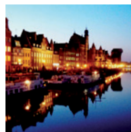
23 KWIETNIA - GDAŃSK