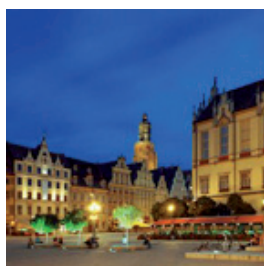
9 KWIETNIA - WROCŁAW